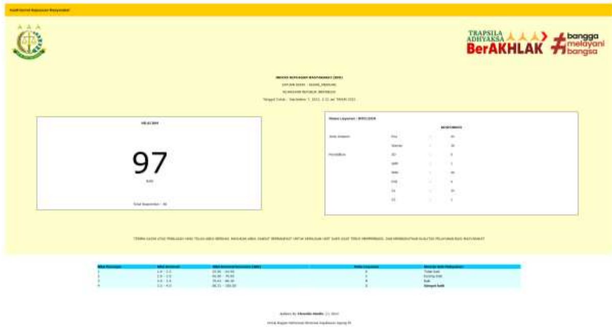
Gambar 3 Nilai IKM kuesioner layanan JMS