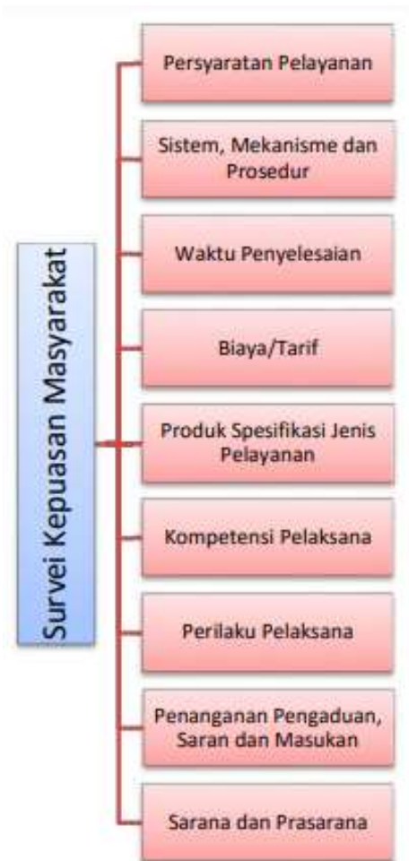
Gambar 1. Model Konseptual Unsur Pelayanan Survei Kepuasan Masyarakat

Adalah segala sesuatu yang dapat dipakai sebagai alat dalam mencapai maksud dan tujuan. Prasarana adalah segala sesuatu yang merupakan penunjang utama terselenggaranya suatu proses (usaha, pembangunan, proyek). Sarana yang digunakan untuk benda yang bergerak (komputer, mesin) dan prasarana untuk benda yang tidak bergerak (gedung).